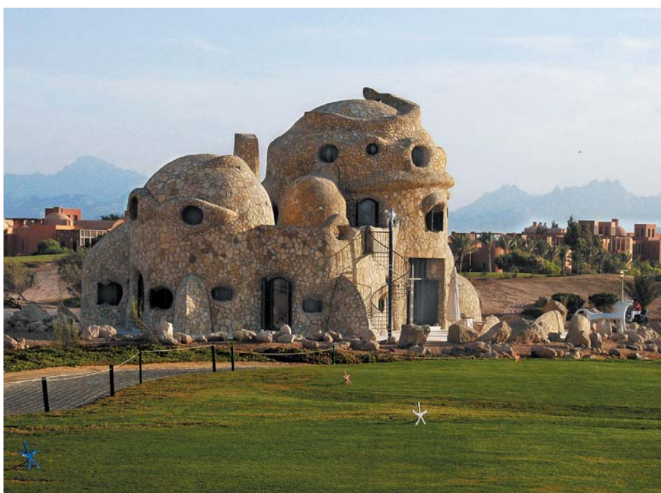
Bilder 12 - 14 »Kid's Fish House«.

wirkt jedoch, wenn man den Blick nach oben wendet, wie eine ägyptische Sphinx. Wie eingeladen – das suggeriert ihre bewegte »Haut« (Oberfläche) schräger und sich aufeinander beziehender Flächen aus handbehauenen Sandstein – tastet sich der Blick mit kindlicher Freude an den Formen weiter und hat plötzlich, am höchsten Punkt des Gebäudes, das schlangenkronierte Haupt eines mit seinem Körper tief in der Erde steckenden »Riesen« vor sich. Doch damit noch nicht genug,